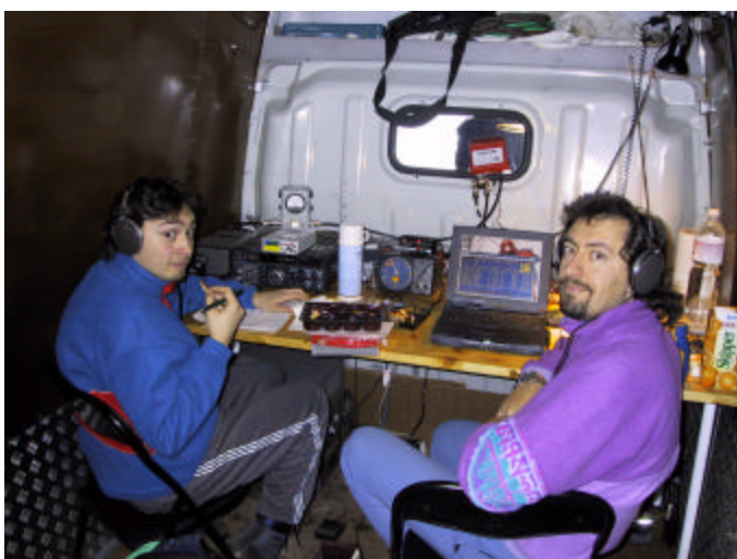
IK5AMB e IW5CFN che operano la stazione speciale I5VMD (Vecchiacchi Memorial Day)

Ringraziando i partecipanti, invitiamo tutti alla prossima edizione nel dicembre 2002