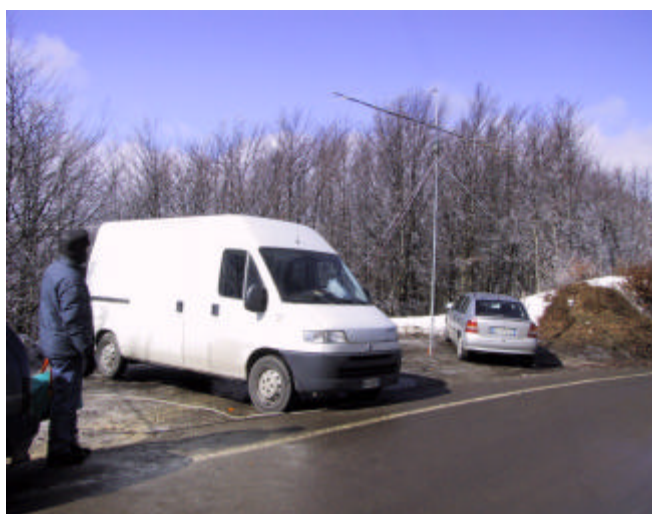
Vecchiacchi Memorial Day 2001 il furgone "Turbocontest" di IK5AMB shack della I5VMD e sullo sfondo la 16JXX2 da Passo delle Radici (LU) JN54FF